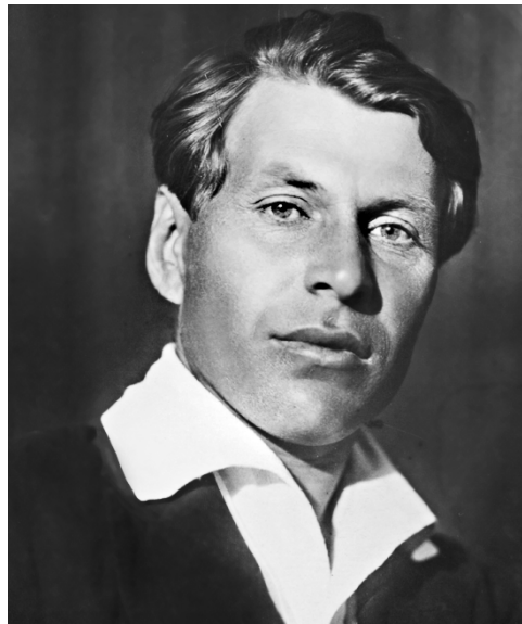
Н. И. Кочин

После публикации романа К. переезжает в Нижний Новгород, чтобы заняться писательской деятельностью, и живет там до последних дней своей жизни. На очерки К. « Записки селькора » (1929) обратил внимание М. Горький. В них автор изображает тяжелое положение родной деревни, живущей кустарным трудом и попавшей в кабалу к спекулянтам. Он приводит подлинные высказывания крестьян о происходящем и, что особенно интересно, о лит-ре. Здесь К. впервые сформулировал свое эстетическое кредо: писать только о том, что знаешь досконально. К. много ездит по стране и сначала оставляет восторженные свидетельства по поводу создания колхозов в деревне. Потом его взгляды резко изменились. Он признает, что коллективизация губительна. В повести «Тара-