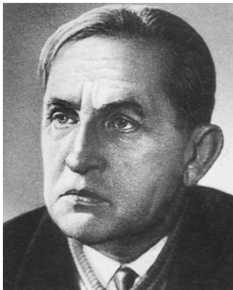
Я. В. Смеляков

СМЕЛЯКОВ Ярослав Васильевич [26.12.1912 (8.1.1913), Луцк Волынской губ.— 27.11.1972, Москва] — поэт.