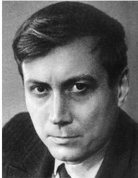
Е. А. Евтушенко

ЕВТУШЕНКО Евгений Александрович [18.7.1933, станция Зима Иркутской обл.] — поэт, прозаик, критик, публицист, кинорежиссер.