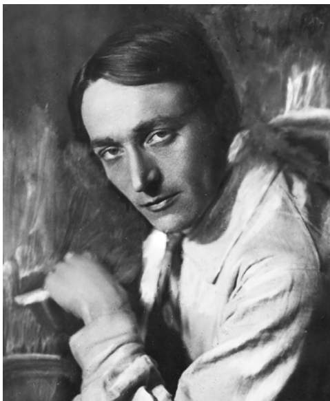
С. Е. Нельдихен

НЕЛЬДИХЕН (настоящая фамилия Нельдихен-Ауслендер) Сергей Евгеньевич [1891, Таганрог — 1942, Москва (?)] — поэт.