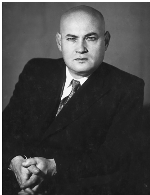
Б. Л. Горбатов

В 12 лет Г. вошел в «детскую коммунистическую группу» и, по собственному признанию, «никогда не был беспартийным». Принимал активное участие в организации объединения пролетарских писателей Донбасса, избирался в правление ВАПП, состоял в секретариате СП СССР и т. д.