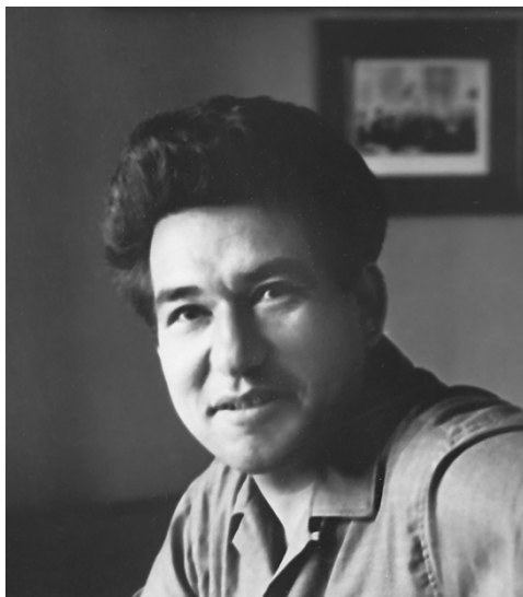
Ч. Т. Айтматов

В 1937 в результате репрессий А. лишился отца, партийного работника, слушателя Ин-та красной профессуры, а также и мн. др. родственников; большую роль в его формировании сыграли мать, учительница, и бабушка — знаток фольклора, киргизского и казахского. С 10 лет А. познал труд земледельца. В годы Великой Отечественной войны, хорошо зная русский яз., подростком исполнял обязанности секретаря сельсовета, налогового агента, учетчика комбайнового агрегата и т. д. А. принадлежит к поколению, «не успевшему» на войну, но тяжкий опыт жизни народа в тылу впоследствии отразится в ряде его произведений — изнурительный труд женщины, голодный блеск ребячьих глаз, страшные листки похоронок.