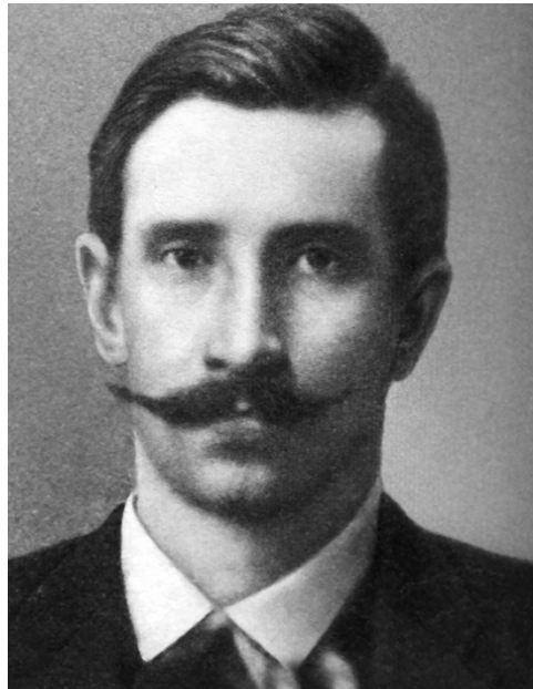
А. С. Грин

Детство и юность Г. провел в Вятке. Отец Г., польский дворянин, оказался в Вятской губ. после ссылки за причастность к польскому восстанию 1863; работал помощником управляющего пивным заводом, бухгалтером в земской больнице. Мать происходила из мещан; умерла в 1893, когда Г. было 12 лет. Воспитанием Г. занимались мало, однако начальное образование он получил дома. Отношения с родителями были напряженными. Г. учился в Вятском земском реальном училище, хорошо успевая по гуманитарным предметам и не успевая по точным наукам. Из этого заведения Г. был исключен за нарушение дисциплины (за «стихотворный пасквиль на учителя», подражание пушкинскому «Собранию насекомых»); впоследствии его приняли лишь в не отличающееся завидной репутацией Вятское городское училище. Г. рано начал читать, его любимыми авторами стали Майн Рид, Густав Эмар, Жюль Верн, Луи Жаколь. Однако Г. была знакома и классическая рус-