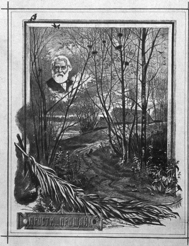
Обложка журнала «Стрекоза» (1883, № 39). По рисунку М. Е. Малышева.