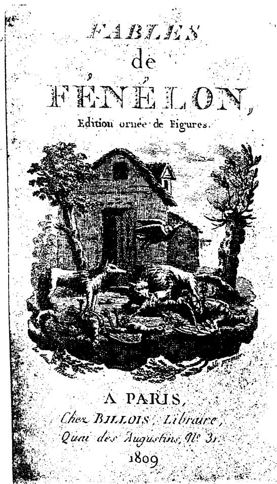
Титульный лист книги „Басни Фенелона“, принадлежавшей А. Пушкину.