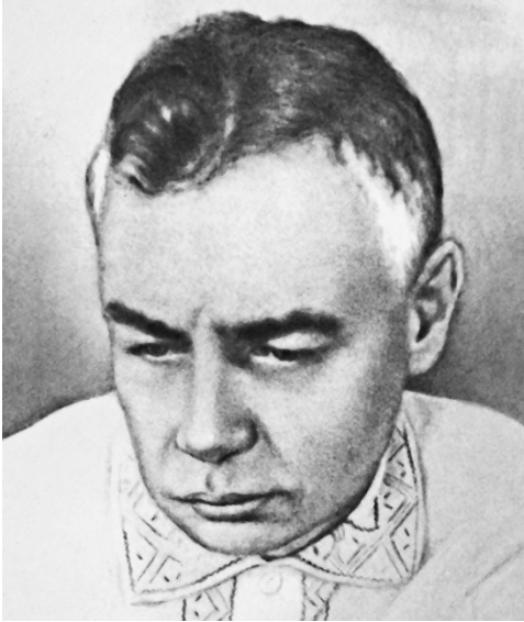
А. К. Воронский

людии становится большевиком, выполняет партийные поручения. Один из активных участников бунта в семинарии, исключен из семинарии в 1905 за «политическую неблагонадежность». С этого времени — профессиональный революционер; вскоре он покидает родные места, живет на нелегальном положении в Петербурге и Гельсингфорсе. 18 сент. 1906 его настигает первый арест, за которым следует годичное заключение в крепости. Спустя полтора года — в февр. 1907 — второй арест и высылка на 2 года в Яренск Вологодской губ. Партийные задания бросают его то во Владимир, то в Саратов, то в Одессу. В. знакомится с видными большевиками — М. И. Ульяновой, М. В. Фрунзе, В. В. Воровским и др. В 1911 впервые печатает свои очерки и статьи в одесской газ. «Ясная заря».